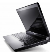
Prêt d'un portable lors d'absences prolongées

L'élève aura accès à un mini-portable lors d'absences prolongées en lien avec la pratique de son sport pour lui permettre, entre autres : de suivre ses cours en temps réel ou de recevoir des explications par vidéo-conférence, d'avoir accès aux capsules de formation déposées sur le portail, d'avoir accès au portail pour connaître les travaux devoirs et leçons à faire, de communiquer avec ses enseignants pour toute question ou difficulté, d'échanger des informations ou de transmettre ses travaux par courriel.